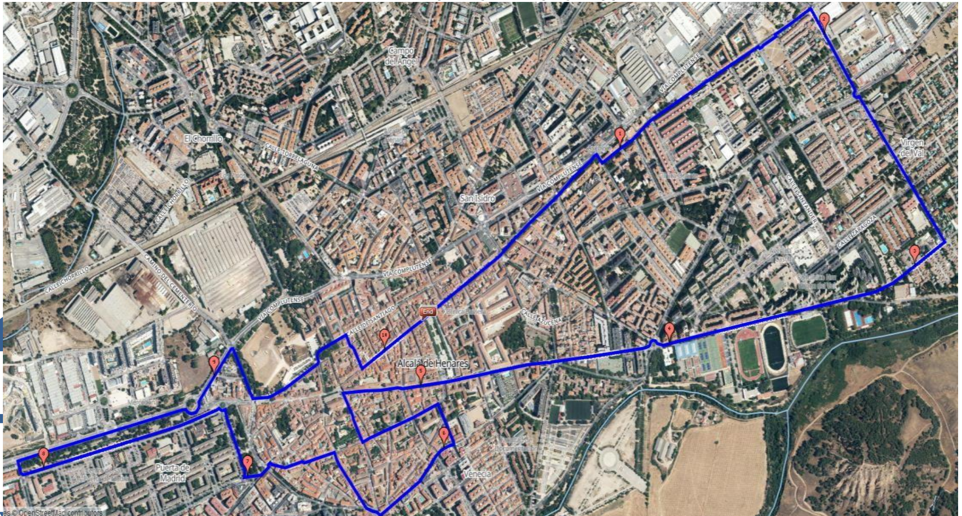
PLANO CON EL RECORRIDO DE LA MEDIA MARATON