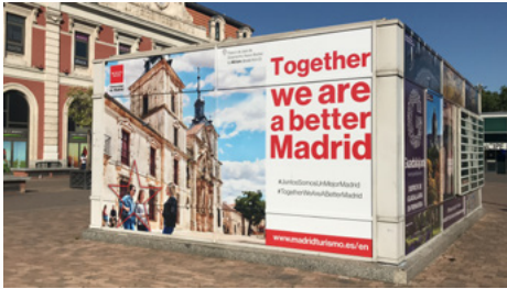
→ Cubos situados en el intercambiador de transporte de Príncipe Pío de Madrid