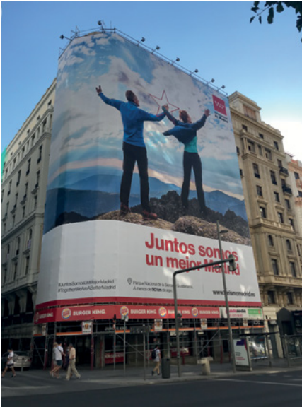
↓ Lona situada en la Gran Vía de Madrid