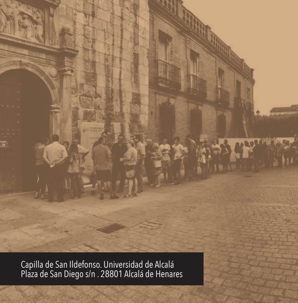
Capilla de San Ildefonso. Universidad de Alcalá Plaza de San Diego s/n . 28801 Alcalá de Henares